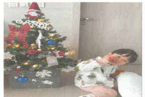
12월 집콕놀이 크리스마스 트리만들기