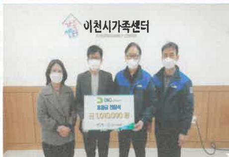
12월 (주)DIG에어가스 다문화가족 위한 후원금 전달