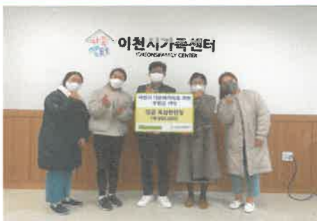
12월 중포 칸다빌 어린이집 다문화가족 자녀를 위한 후원금 전달