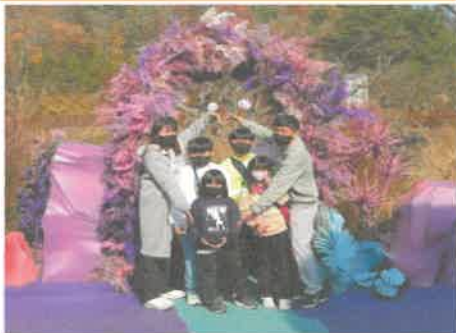
11월 다문화가족 에버랜드 문화체험