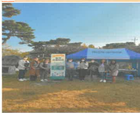
10월 찾아가는 외국인주민 무료상담 운영