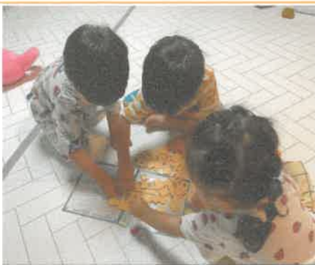
10월 집콕놀이 한글보드게임&할로윈쿠키 만들기