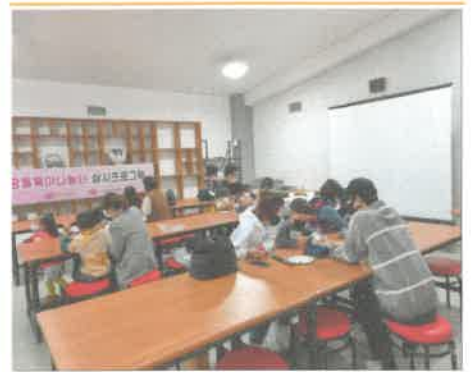
10월 이천공동육아나눔터 “자연을 빛다, 도자기 만들기”