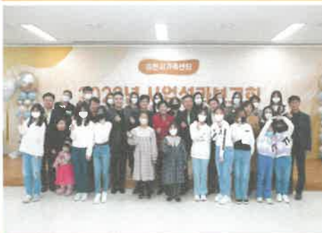
11월 센터 사업성과 보고회