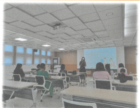
7.9 이천시공동육아나눔터 부모가 먼저 배우는 성교육