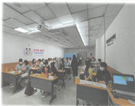
7.9 슬기로운 커플백서 예비부부 관계향상 교육