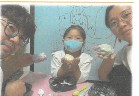
9.6 9월 집콕놀이달인 송편만들기 체험