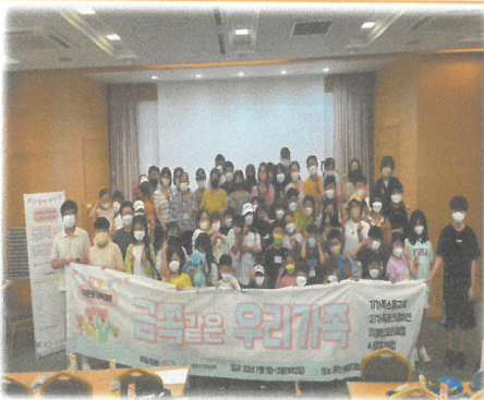
7.1 다문화가족캠프 금쪽같은 우리가족