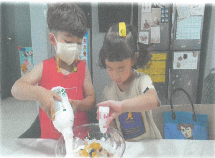
8.9 8월 집콕놀이달인 수박화채만들기