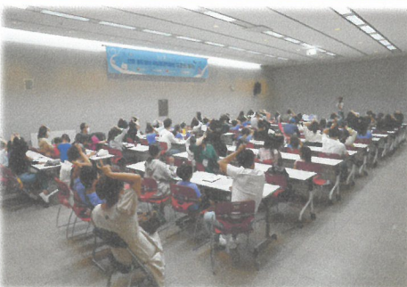
8.9 이천시공동육아나눔터 국립중앙박물관 도슨트 투어