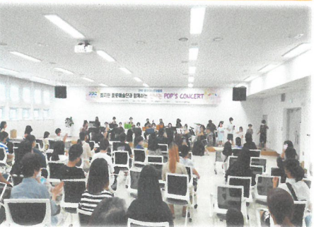
8.27 신나는 팝스콘서트