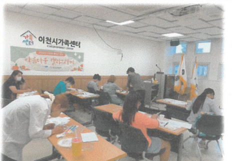
8.26 다문화동아리모임 캘리그래피 체험