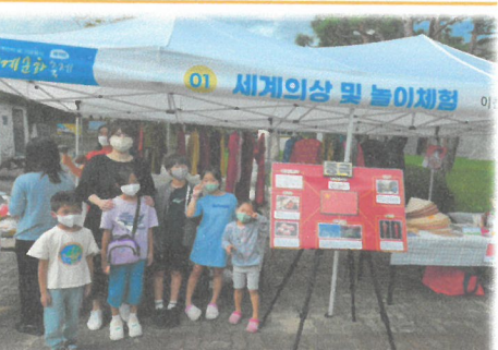
9.3 세계인의 날 제9회 이천세계문화축제